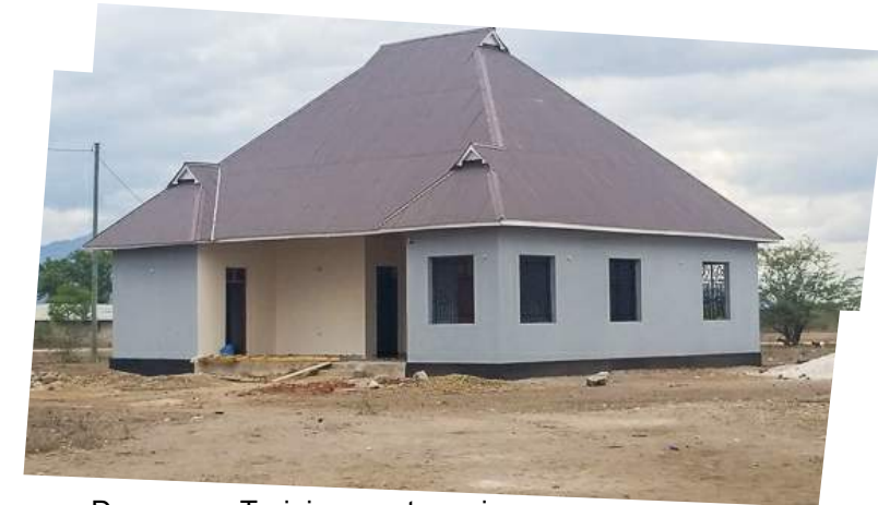
Das neue Trainingszentrum in Toloha, Bauzustand im Juli 2022.

Informationen zu unseren Aktivitäten finden Sie immer aktuell auf unserer Webseite: www.tolohapartnership.de