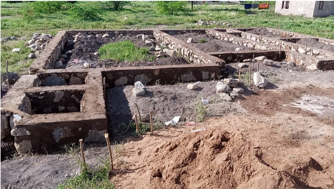
Das Fundament für das Multifunktionsgebäude ist gelegt.