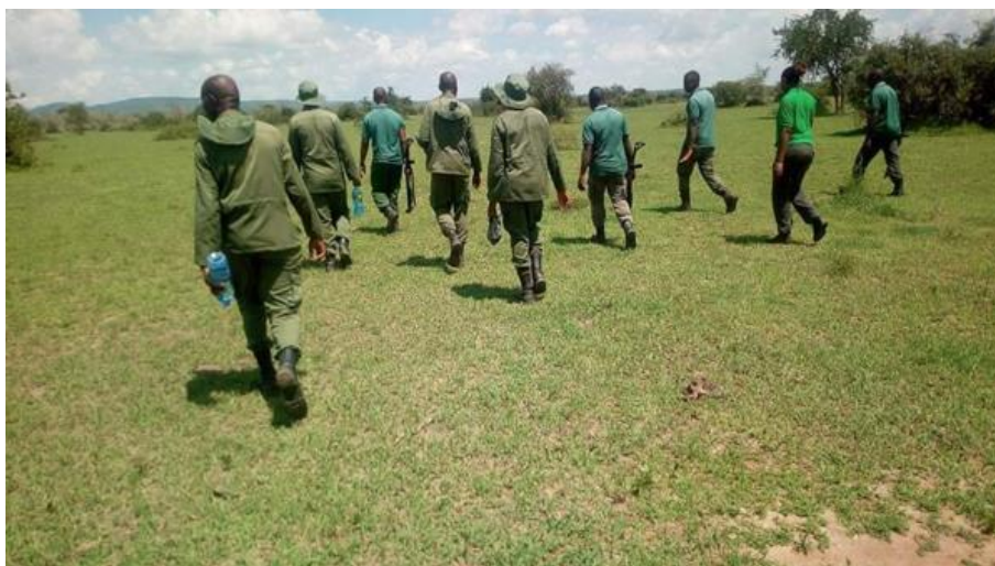
Ranger unterstützen beim Wildtier-Management