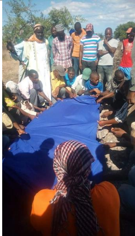
Ein von einem Leopard tödlich verletzter Junge wird beerdigt