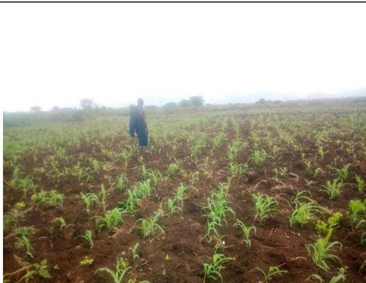
Bauern bei der Feldarbeit in Toloha

In der Region um das vom Verein „Toloha Partnership Deutschland e.V.“ unterstützte Dorf Toloha sind es genau diese indirekten Folgen der Pandemie, die den Menschen die größten Sorgen und Probleme bereiten. Zwar spielt der Tourismus für Toloha unmittelbar noch keine Rolle, doch haben der allgemeine Lockdown und die erneut heftigen Überschwemmungen in der Regenzeit zu verstärkter Armut bis hin zu Lebensmittel-Engpässen geführt. Ein Teil der Ernte wurde vernichtet. Die Kleinbauern pflanzen gerade ihre Felder neu an. Bis diese neue Saat erntereif ist, müssen viele Familien eine lange Zeit mit wenigen oder gar keinen Vorräten überbrücken. Der Verein hat sich daher entschlossen, mit einer direkten Lebensmittelhilfe den Menschen im Dorf bei der Überbrückung dieser schwierigen Zeit zu helfen. Für diese Hilfe bittet der Verein um Spenden. Die Lebensmittel (Reis und Bohnen) können im Land gekauft werden, müssen jedoch mit einem LKW nach Toloha transportiert werden. Auch dringend benötigte Hygieneartikel und Medikamente sollen auf diese Weise nach Toloha geschafft werden.