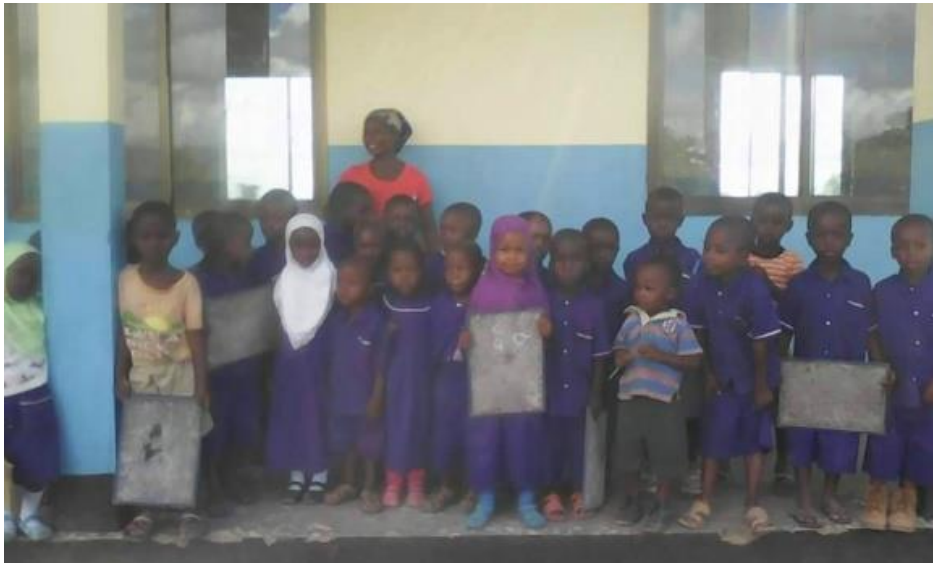
Glückliche Kinder - Beginn des Unterrichts am 27. März 2017

Platz und begannen mit dem Unterricht. Wir sind voller Freude über das erreichte Ziel und bedanken uns ganz herzlich bei allen Beteiligten, Spendern und Helfern. Jeder Einzelne von euch hat zum Gelingen dieses Projektes beigetragen und kann stolz und glücklich sein über das Ergebnis und die Freude im Dorf!