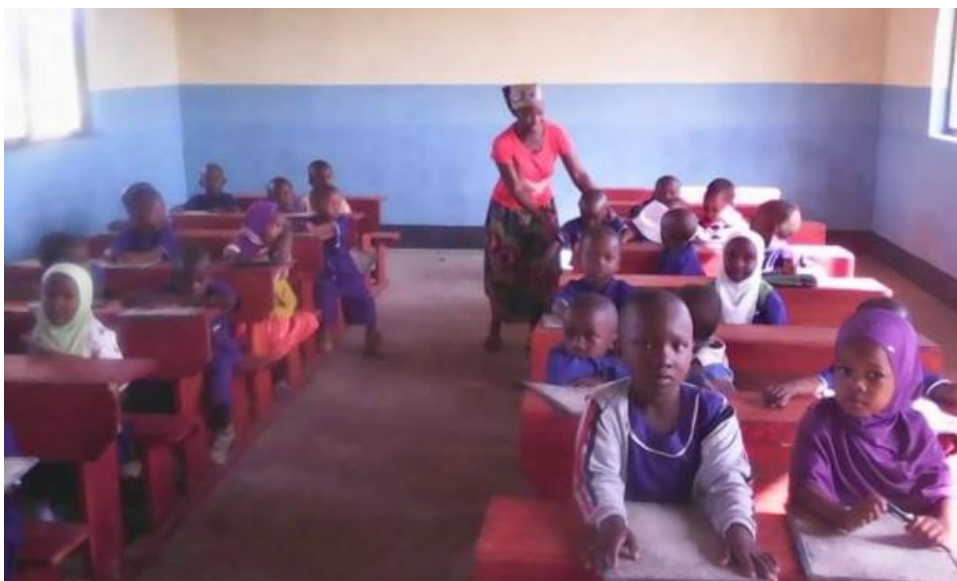
Viel Platz zum Spielen und Lernen im neuen Gebäude

Ebenso hält euch unser facebook-Auftritt auf dem Laufenden: https://www.facebook.com/tolohadeutschland/