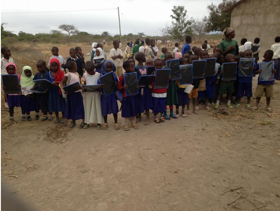
Neue Schreiftafeln für die Kleinsten

Wir sind in Verhandlung mit verschiedenen Partnern vor Ort um den Kindergarten mit neuer Möblierung und mit einer Photovoltaik-Anlage zur Stromversorgung auszustatten.