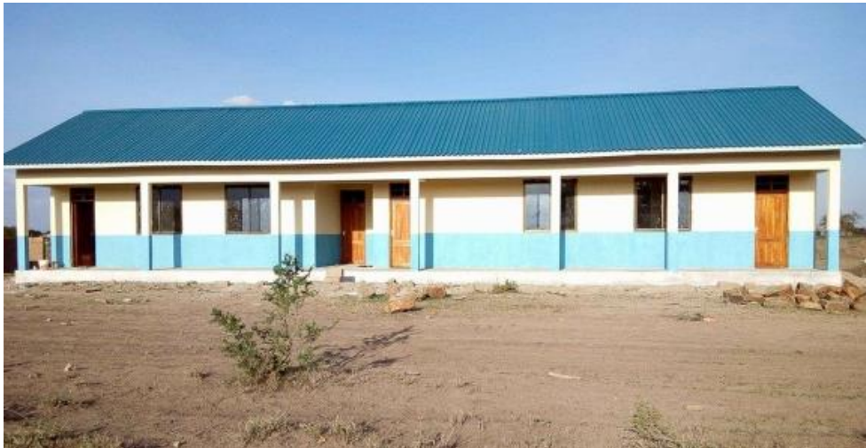
Der neue Kindergarten, Dezember 2016

Ganz besonders möchten wir uns an dieser Stelle bei Bischof Mwakimage und seinem Team bedanken. Mit unglaublichem Eifer und Einsatz ist es ihnen innerhalb kürzester Zeit gelungen das Werk zu vollenden!