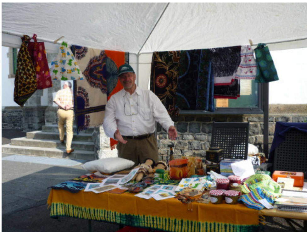
Standpräsentation in Dorchheim