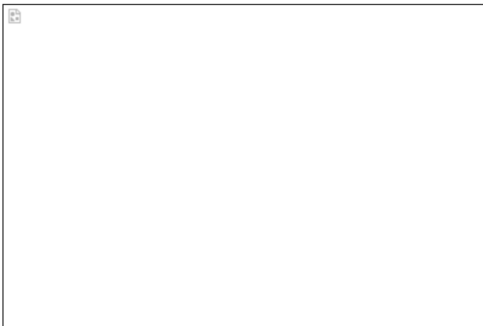
Übergabe der Geschenke in der Primary School Toloha

Bei einem Besuch in der Primary School (Grundschule) von Toloha wurden die mitgebrachten Geschenke im Beisein der Dorfältesten und der Dorfverwaltung an die Lehrer übergeben. Große Freude und Dankbarkeit wurde uns dafür gezollt. Bei der anschließenden Besichtigung der Schule und des Schulgeländes mussten wir den teilweise desolaten Zustand der Gebäude und Räume konstatieren. Der Dorfgemeinschaft fehlen bisher die notwendigen Mittel um aus eigener Kraft für wesentliche Besserung zu sorgen. „Toloha Partnership“ wird hier in Zukunft unterstützend helfen!