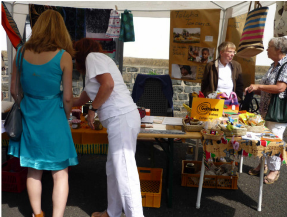
Interessenten beim Erkunden unseres Angebotes