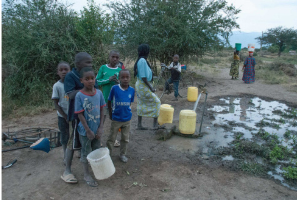
Wasser fließt mit dickem Strahl aus der noch provisorischen Zapfstelle

Noch fließt das Wasser nur an provisorischen Zapfstellen, doch bis Anfang August diesen Jahres soll das neue Verteilsystem in Betrieb sein. Wichtig ist für alle Beteiligten, dass das Projekt als echte „Hilfe zur Selbsthilfe“ verstanden wird um nachhaltig bestehen zu können. So haben die Dorfbewohner - wo immer möglich - mit eigenen Händen die Leitungsgräben ausgehoben und die Wasserleitungen verlegt. So wird die „ownership“ gewährleistet.